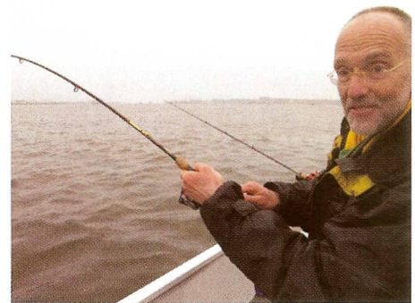
De dokter tijdens de drill van een snoekbaars: "Op dit moment wordt er dus serotonine in mijn hersenen aangemaakt!"